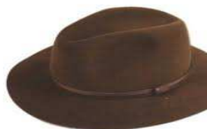
chapeau de Nestor Burma