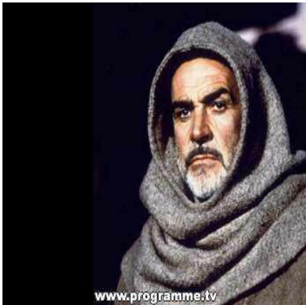
Guillaume de Baskerville dans le film Le nom de la rose.