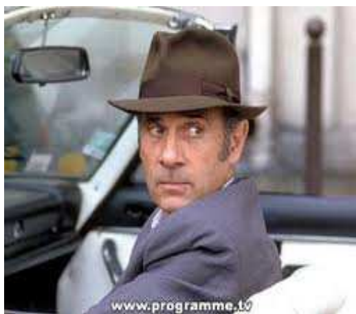
photo de Guy Marchand qui incarne Nestor Burma