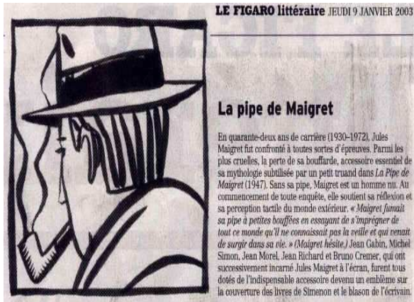
photo de la pipe et du chapeau mou de Jules Maigret .

Nom:Maigret Prénom:Jules Amédée François