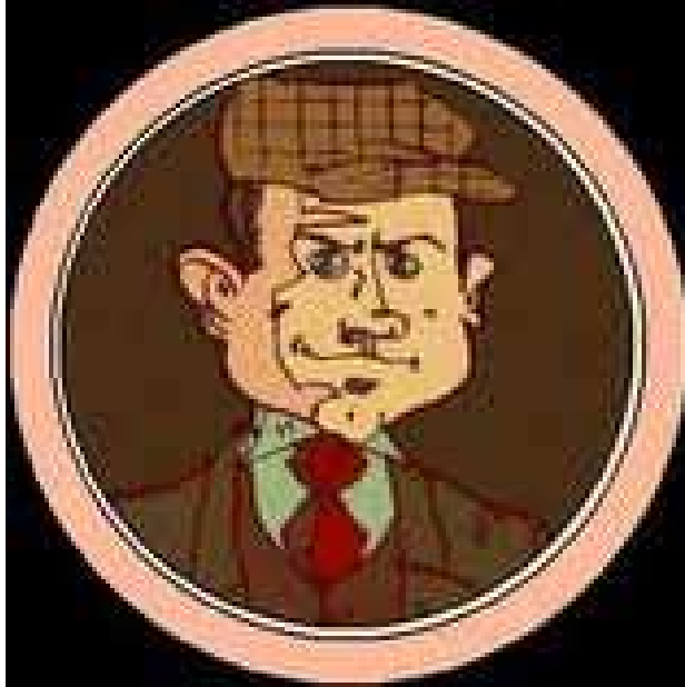
illustration de Rouletabille avec son équipement