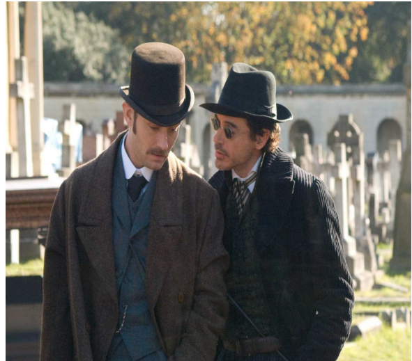
Watson est à droite photo tirée du film SHERLOCK HOLMES .