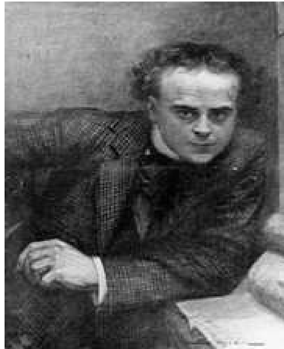
illustration représentant Rouletabille