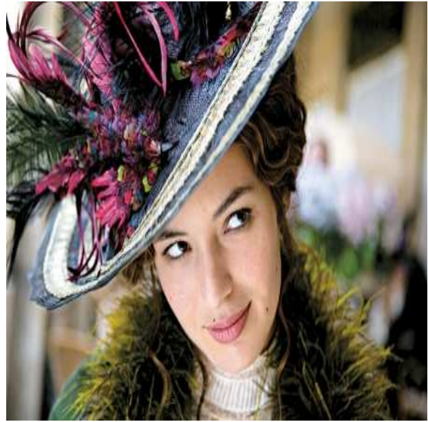
Adèle Blanc Sec